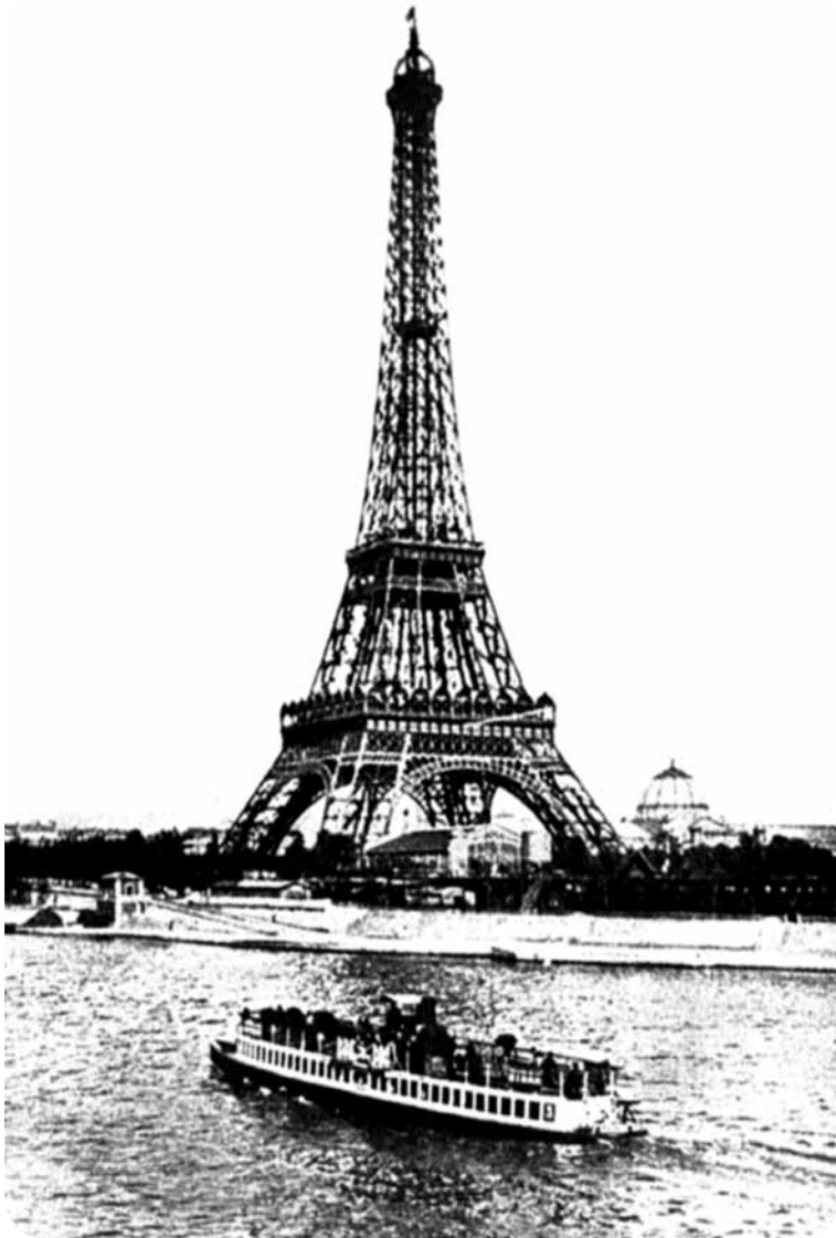
Lámina Nº 3. Gustave Eiffel. Torre Eiffel. París.