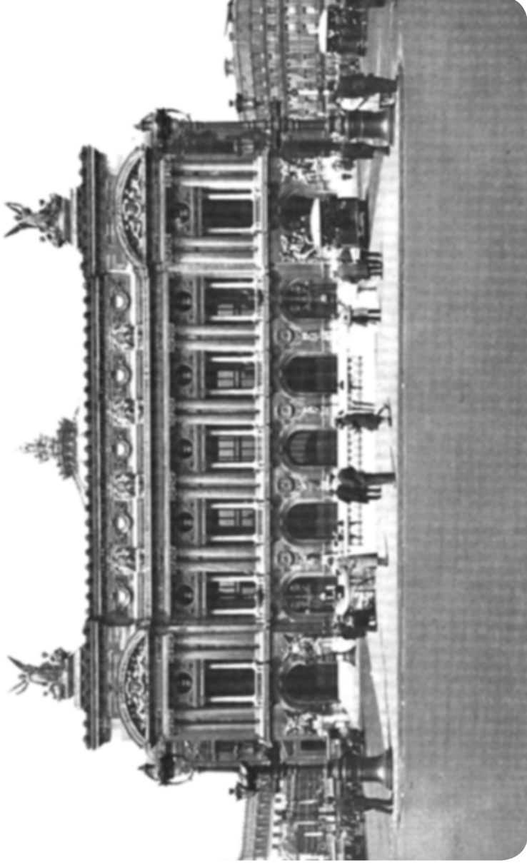
Lámina Nº 4. Charles Garnier: Ópera. París.