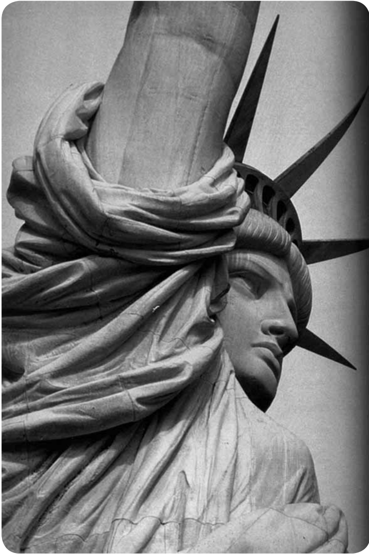
Lámina Nº 2. Frederic Auguste Bartholdi. Estatua de la Libertad. Nueva York.